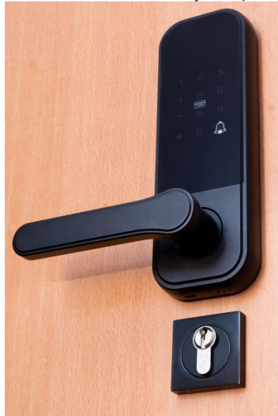
Widok od strony zewnętrznej